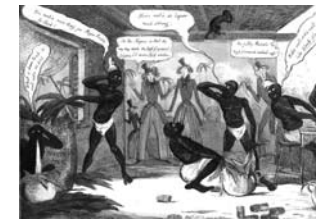
Manufacturing Cigars for the Poodles. A Sketch from the Havannah! H. Heath (grabado); S. W. Pores (editor) Londres, 1827 Aguafuerte y aguatinta iluminado. Papel vitela Papel: 265 x 385 mm. Huella: 245 x 343 mm.