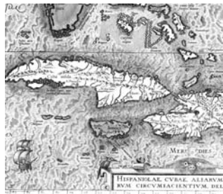
Culiacanae Americae regionis... / Hispaniolae, Cubae... Abraham Ortelius (1527-1598) Estampa de la obra Theatrum Orbis Terrarum Amberes, 1584 (Primera edición) Buril iluminado. Papel verjurado Papel: 413 x 520 mm. Huella: 357 x 498 mm.