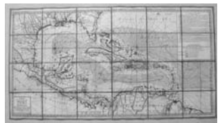
Carte du Golphe de Mexique et des Isles Antilles Ph. Buache y J. N. Buache (geógrafos); J. A. Dezauche (grabado y editor) París, 1780 Buril iluminado. Papel verjurado encolado sobre tela. 24 pliegues formando un total de 520 x 960 mm.