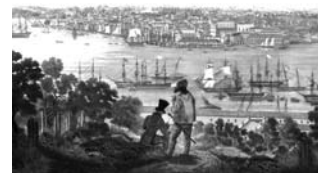
Vista general de la Habana Hippolyte J. Baptiste Garneray (1787- 1858) (dibujo y grabado) París, ca. 1830 Aguatinta iluminada. Papel vitela Papel: 455 x 570 mm.