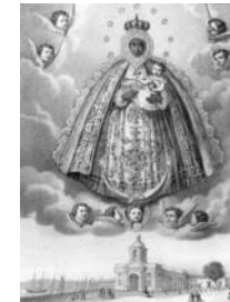
Verdadero retrato de la imagen de la Santísima Virgen de la Regla L. Turgis (editor) París, mediados siglo XIX Litografía iluminada. Papel vitela Papel: 275 x 200 mm.