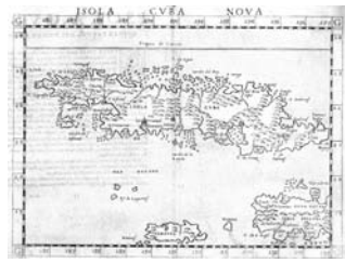
Isola Cuba Nova Girolamo Ruscelli (1504-1566) Estampa de la obra La Geografia di Claudio Tolomeo Alessandrino Venecia, 1561 Buril. Papel verjurado Papel: 215 x 300 mm. Huella: 190 x 260 mm.