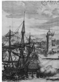
Havana John Ogliby (1600-1676) De la obra de Arnold Montanus De nieuwe en weereld onbekende Londres, 1671 Aguafuerte y buril. Papel verjurado Papel: 297 x 370 mm.