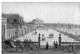
Vista de la Alameda de Paula en la Habana Hippolyte J. Baptiste Garneray (1787- 1858) (dibujo y grabado) París, ca. 1830 Aguatinta y aguafuerte iluminado. Papel vitela Papel: 445 x 565 mm.