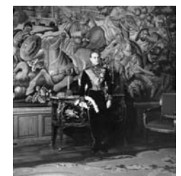
Conjunto de documentación varia de D. Héctor de Ayala Fotos, legajos y pliegos varios manuscritos e impresos (ejecutorias de nobleza, pleitos, ápoas, etc.) Siglos XVI-XX