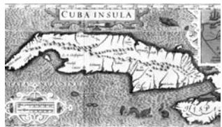
Cuba Insula / Hispaniola Insula Gerhard Mercator (1512-1594) y Jodocus Hondius (1563-1612) Estampa de la obra Atlas . Amsterdam, 1606 (Cuarta edición, 1619) Buril iluminado. Papel verjurado Papel: 430 x 545 mm. Huella: 355 x 500 mm.