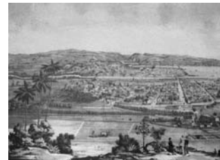
Isla de Cuba Pintoresca. Vista de la Ciudad de Matanzas tomada desde el Monte de Cafetal de Dn. Vicente Guerrero Leonardo Barañano (dibujo); E. Bourrelhier (litografía); La Marina (editor) Cuba, 1856 Litografía iluminada. Papel vitela Papel: 560 x 785 mm.