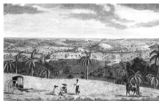
Vista del puerto y ciudad de la Habana desde Jesús del Monte Elias Durnford (dibujo); T. Morris (grabado); John Bowles (editor) Londres, 1768 Aguafuerte y buril iluminado. Papel verjurado Papel: 360 x 527 mm.