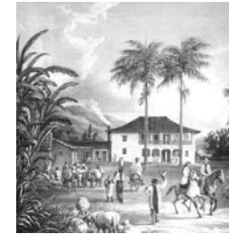
Vista de la hacienda "El Palmar" de San Mateo en los Valles de Aragua Fr. Melby (dibujo); Otto Speckter y Niedorf (litografía) Hamburgo, mediados siglo XIX Litografía iluminada Papel vitela encolado sobre cartón Papel: 350 x 375 mm.