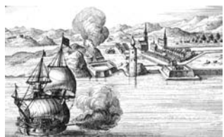
Havana. Portus Anónimo Siglo XVII Buril. Papel verjurado Papel: 130 x 190 mm.