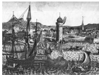
A View General of the City de Havana of Amerique Anónimo. Daumont (editor) Vista óptica París, segunda mitad siglo XVIII Aguafuerte y buril iluminado. Papel verjurado Papel: 285 x 370 mm.