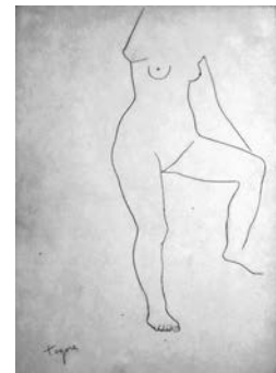
JOSEP DE TOGORES (Cerdanyola del Vallés, 1893 - Barcelona, 1970) Nu femení Sense datar Signat a llapis Llapis. Paper vitel·la 355 x 245 mm.