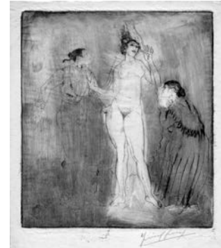
ISMAEL SMITH (Barcelona, 1886 - White Plains, Nova York, 1972) Contrato Nova York, 1919 Primer estat de tres. Signat a llapis Aiguafort. Paper Japó Estampa de la sèrie: Scenes of the Spanish Life Paper: 231 x 205 mm. Petjada: 197 x 175 mm. Antiga col·lecció Enrique García-Herraz.