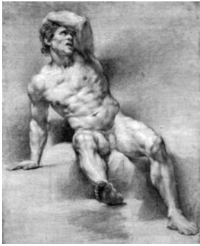
ANTON RAPHAEL MENGES (Aussig, Bohèmia, 1728 - Roma, 1779) Estudi de nu masculí 1774 Llapis, carbonet i tocs de clarió Paper verjurat preparat gris Datat en angle inferior esquerre: 9 [il·legible] 1774 520 x 393 mm.