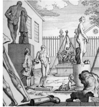
WILLIAM HOGARTH (Londres, 1697-1764) Anàlisi de la Bellesa (detall) Dues estampes (sèrie completa) Londres, 1753 Edició de Baldwin, Cradock & Joy, 1822 Aiguafort i buri. Paper vitel·la Papers: 440 x 540 mm i 460 x 560 mm. Petjades: 390 x 500 mm i 425 x 530 mm. Ref.: Paulson, 195a i 196a.