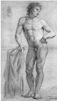
RAFAEL ESTEVE VILELLA (València, 1772 - Madrid, 1847) Estudi de un masculí Sanguina i tocs de clarió Paper verjurat Signat a tinta en angle inferior dret: Rafael Esteve Paper: 555 x 342 mm. Antiga col·lecció Miguel Martí Esteve.